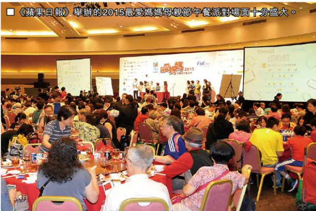
《蘋果日報》舉辦的2015最愛媽媽母親節午餐派對場面十分盛大。

媽媽一年365日都沒有休假，不辭勞苦地照顧全家人的需要，要回饋媽媽，當然要挑選最好的禮物！自家種植人蔘的蔘龍企業（香港）有限公司（下稱：蔘龍）為你照顧媽媽的健康，品牌更鼎力支持《蘋果日報》舉辦的2015最愛媽媽母親節午餐派對，在場內設置攤位，吸引不少母親前來試飲蔘茶，場面熱鬧非常，讓各個媽媽過了一個十分愉快和健康的中午。