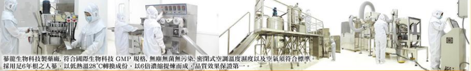
蔘龍生物科技製藥廠，符合國際生物科技GMP規格，無塵無菌無污染，密閉式空調溫度濕度以及空氣須符合標準，採用足6年根之人蔘，以低熱溫28℃轉換成份，以6倍濃縮提煉而成，品質效果保證第一。

蔘龍企業(香港)有限公司將於二零一四年 四月十九日於佐敦金量廷(禮堂)設宴， 屆時設有即場抽獎， 有機會贏取蔘龍人蔘粉產品 首創人蔘生物科技製藥廠，自設唯一高科技奈米真 空濃縮萃取提煉技術設備，採用足6年根之人蔘， 以低熱溫28℃轉換成份，以6倍濃縮提煉而成，品 質效果保證第一。 人蔘具備滋養五臟（心、肝、脾、肺、腎），並可 達到養、潤、滋、溫的雙向功能，從而達到全面 性調理的作用，使體內各個器官都能正常運作，抗 體提升，增強免疫系統，強化自然自癒力，改善體 質，令身體健康。