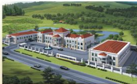
蔘龍長白山人蔘生產種植基地

在處理人蔘的過程，蔘龍採取一絲不苟的態度，與20位中醫、人蔘等領域專家組成研發團隊，一同開創一個完整的、符合生產質量管理規範(GMP)認證的人蔘產業。團隊同時摒棄傳統處理人蔘的方法，改用以28度低溫處理，性質更溫和。蔘龍自設蔘龍生物科技製藥廠，以現代科學技術提煉，經過14個萃取過程，才可從每100公斤的人蔘中，萃取20公斤的精華。