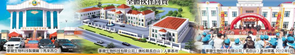
蔘龍生物科技製藥廠(馬來西亞) 蔘龍生物科技有限公司(撫松縣長白山)人蔘基地 蔘龍生物科技有限公司(長白山)基地開幕 2012年9月