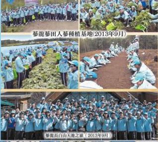
蔘龍人蔘種植基地 2013年9月 蔘龍人蔘種植基地 2013年9月 蔘龍人蔘種植基地 2013年9月